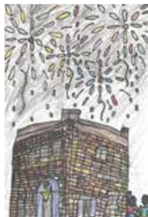
【小学生高学年の部最優秀賞】 「赤レンガ館と花火」