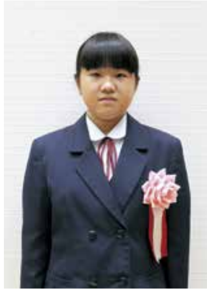
新谷中学校 1年 （表彰時：新谷小 6年）