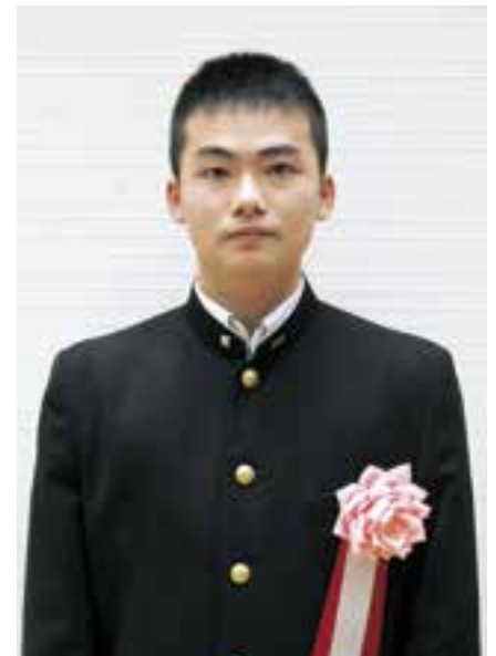
八幡浜工業高等学校 3年