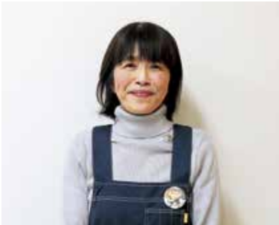
読み聞かせボランティア プラタナスの会