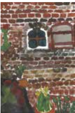
【小学生低学年の部最優秀賞】 「赤レンガかん」