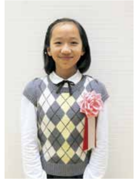
大洲小学校 4年（表彰時 3年）

平成30年度土砂災害防止に関する作品コンクール 小学生・絵画の部 「国土交通大臣賞」