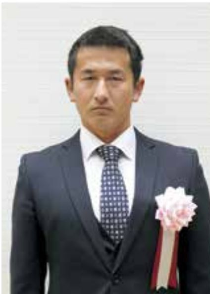
大洲高等学校 肱川分校教諭