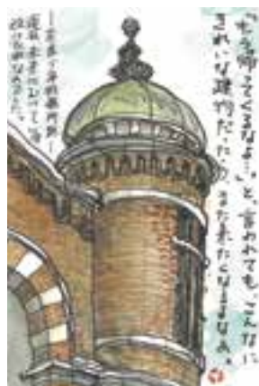
【高・大・一般の部最優秀賞】 「また来たくなるよなあ…」