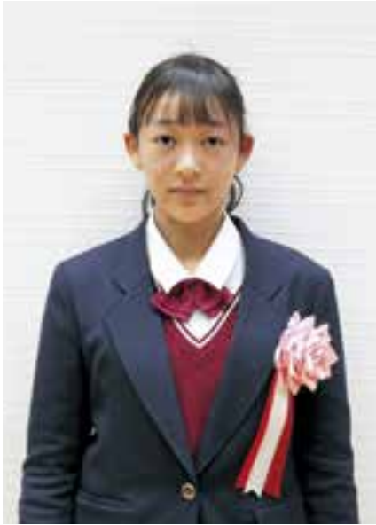
済美高等学校 1年 （表彰時：大洲北中 3年）