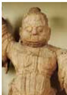
木心乾漆造毘沙門天立像 木造兜跋毘沙門天立像

【会期】3月22日(日)まで 【会場】奈良国立博物館 (奈良市登大路町50番地)