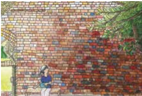
【大洲市長賞】「光にてらされて」