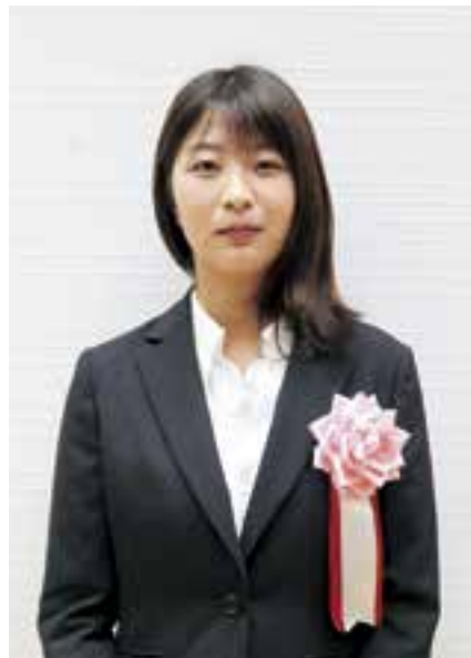
松山東雲女子大学 3年

2019 ICF カヌーマラソン世界選手権大会兼アジア選手権大会 男子カナディアンシングル 短距離 「アジア第3位」