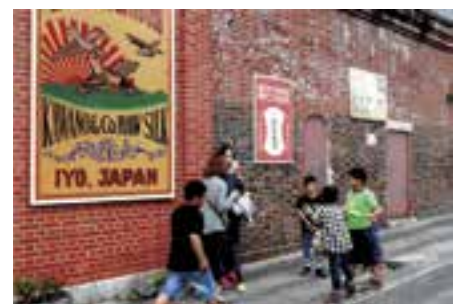
【写真の部最優秀賞】 「憩いの広場」