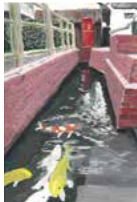
【中学生の部最優秀賞】 「れんがに区切られた鯉だけの世界」