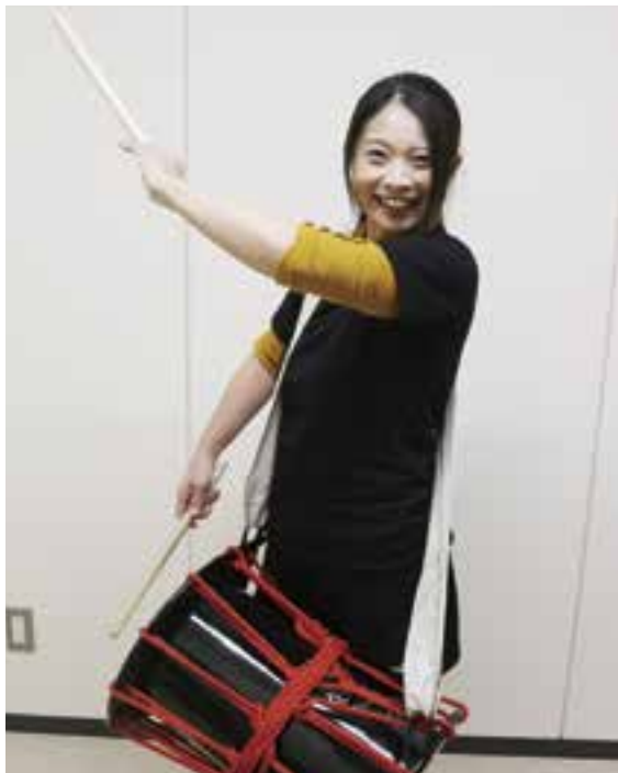
和太鼓ユニット みゆう