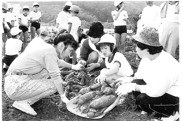
▼サツマイモを掘る親子

は四苦八苦。なかなか丸く延ばせず、先生に助けを求める一幕も見られましたが、どの顔もいきいきと楽しそうでした。最後は試食会を開き、自分達の作品を、みんなでおしく食べました。