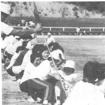
つなひき おかあさん！日頃貯えた力を出して 頑張つて……

昭和五十五年市民運動会は、体育の日の十月十日、運動公園陸上競技場で開かれました。当日は、快晴で絶好の運動会日よりで、各地区から多数の皆さんが参加し、日頃鍛えた体力を十分に発揮し「体育の日」にふさわしい市民の運動会でした。競技は、小学生リレーより始まり、地区対抗戦では、前回最下位の柳沢地区が奮起し各種目に高得点を重ね、見事優勝を果たしました。各地区の得点は表の通りです。