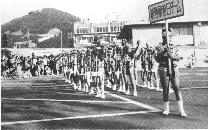
優勝した新町駅前チム

恒例の「商工まつり」が、十一月一日から五日まで、市内各所で繰り広げられました。 二位には、大洲ばやしの市中パレードが行われ、十五団体六五〇名が参加して大洲ばやしの競演。審査の結果、新町駅前チムが今年、最も素晴らしい踊りと決定しました。入賞チムは次のとおりです。 一位 新町駅前チム 二位 伊予銀行チム 三位 市役所Aチム 四位 Bチム 五位 エヒメ住宅チム