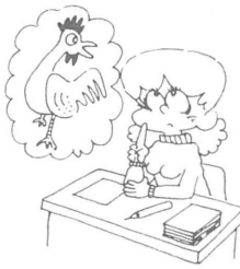
年賀状の差し出し準備を

今年も年賀状を準備する時期になりました。 年末も押し迫ると何かと忙しくなり、ますので、お早めに年賀はがきをお買い求めいただき、十二月十五日の引受開始日には出せるようにご準備ください。