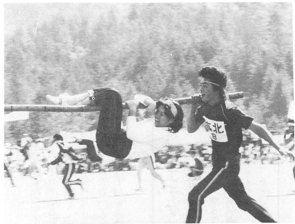
おさるのかごや この人たち、本当に大丈夫かしら、 少し心配だわ？