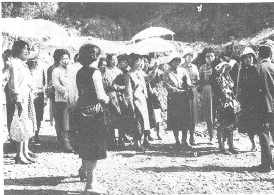
長谷の不燃物処理場にて

を愛する心を養い、日常生活を改善向上する目的のふるさと婦人学級では、十月九日に四回目の学習として、市内の衛生施設の見学をしました。