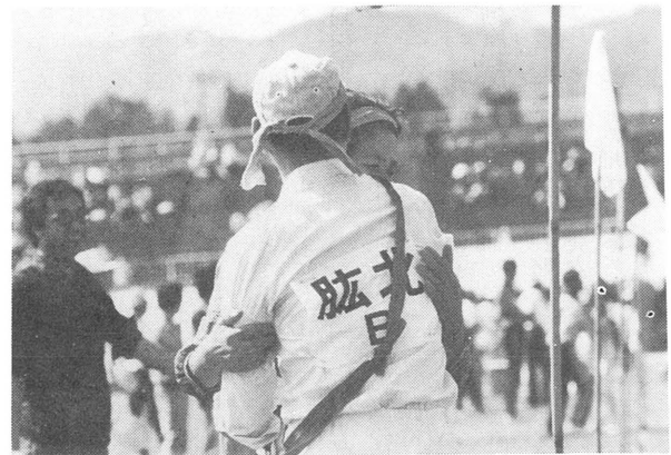
風船割り 思ったよりむつかしいわ……