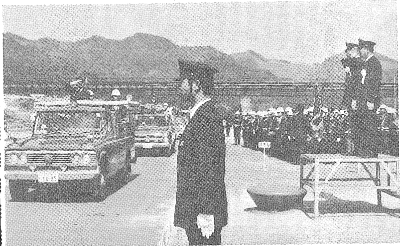
堂々と行進する消防機動隊

恒例の大洲市消防出初式が今年も「春の全国火災予防運動」期間(二月二十八日から三月十三日)中の、三月三日午前九時から、肱川緑地公園で行われました。 出初式には、市内唯一の田ノ久保備入消防隊をはじめ、大洲市消防団員、消防警員、横野私設消防隊など、約九百人が参加して、人員服装点検、機械器具とポンプ操作、消防本部の消防演習があり、火災に備えての日ごろの訓練の成果を披露しました。 ついで、消防活動などに功績のあった人たちに表彰や感謝状が授けられました。 また市長の訓示のあと、来賓祝辞と、各分団の分列行進があり、最後に肱川河原で一声放水を行い出初式を終りました。 この日表彰された方は次のとおりです。