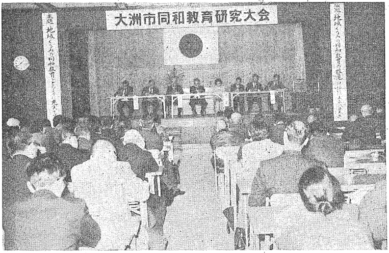
真剣に討議する全体会

市教育委員会、市同和教育研究協議会主催による、昭和五十二年大洲市同和教育研究大会が「地域ぐるみの同和教育を」というテーマで、三月一日午前九時から市民会館で開催された。