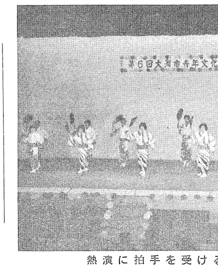
熱演に拍手を受ける青年たち

現在管理をしている市営住宅に空家ができた場合に入居できる補欠入居者を、次の要領で募集します。