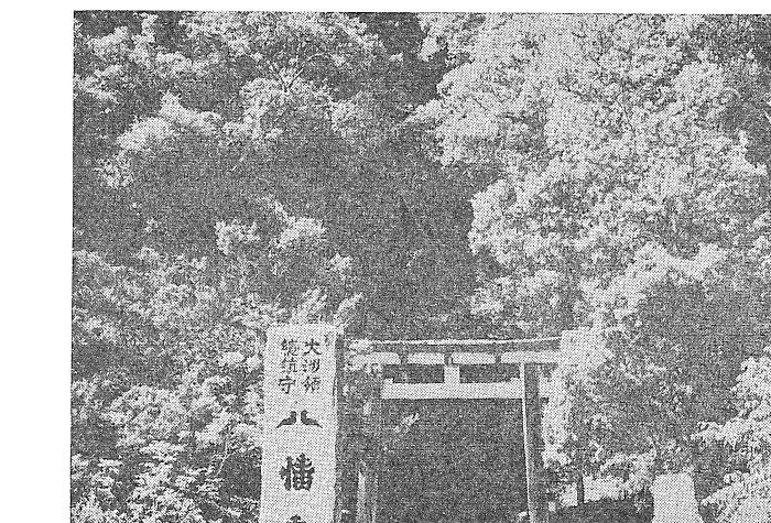
大洲の文化財 八幡神社

休日急患診療 11月3日 中央病院 4501 6日 中央病院 4501 13日 加戸病院 5101 20日 加戸病院 5101 27日 中央病院 4501