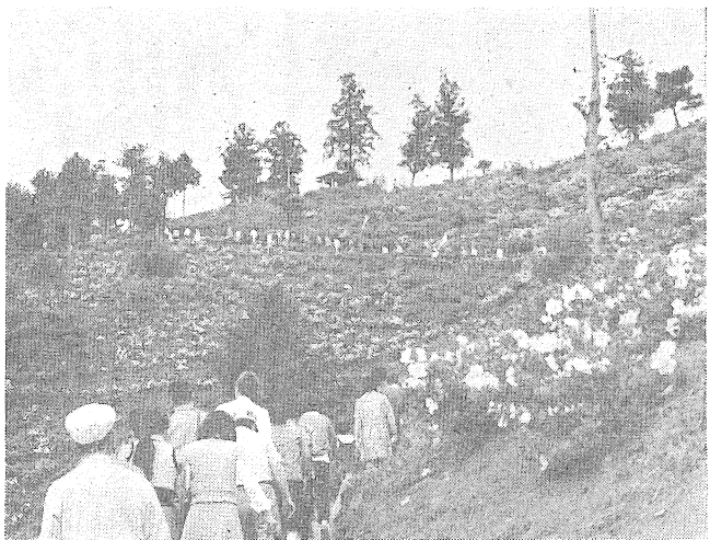
家族づれなどでにぎわう富士山公園

つつじ約三万五千本が、色とりどりに咲きほころび、富士山公園のつつじまつりが、四月二十五日から五月十五日まで行われました。