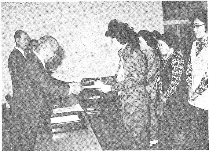
村上市長から委嘱状を受けるモニター

五月六日、中央公民館で、昭和五十一年度の消費生活モニター委嘱式を行いました。 委嘱式は、村上市長から市民の皆さんが、健全で合理的な消費生活をするために尽力していただき、と委嘱状を手渡し、続いて本年度の事業計画、懇談会や研修会の開催などを決めました。 この制度は、消費者の意見や要望などを吸収し、これを行政府や業界に反映させる仕事をしていくものです。