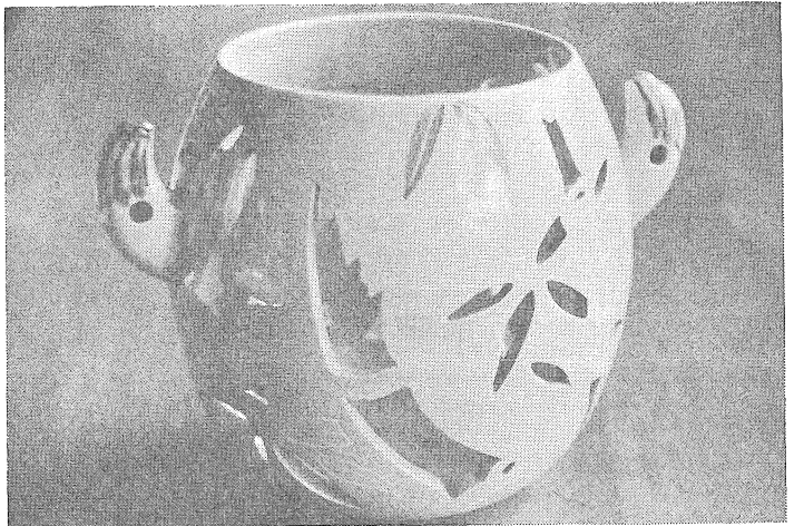
器透入り竹の瀬瀬梁

栗の早期収益の確保を目的として、計画的な密植栽培が普及して十数年を過ぎた今日、計画的な間伐を怠るべきである。間伐は、樹木の生長を助長し、竹木を立上らせたような形となつて、結果として、密植による害が現れているのが現状であります。 栗の収穫最盛期は五、六年生といわれていますが、計画的に間伐をすれば、二、三、四年生頃まで安定した高収量をあげることが可能です。 間伐は密植の樹を間引くことであり、密植の樹を間引くことにより、残った樹の生長を助長し、竹木を立上らせたような形となつて、結果として、密植による害が現れているのが現状であります。 間伐の時期は、収穫後から三ヶ月までの間といわれていますが、下枝の充実を良くするため収穫後出来るだけ早目に行つてよいでしょう。 また間伐は、二月から三月頃が適期であります。 大洲農業改良普及所