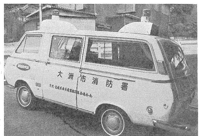
寄贈を受けた救急自動車

愛媛県共済農業協同組合連合会より交通福祉総合対策の一環として、救急自動車等の現物を次のとおり寄贈を受けました。 救急自動車 一台 スクール・ゾーン標識五〇〇枚 交通安全教育用指道板 一組 (喜多小学校) 市立大洲病院(救急医療機器)