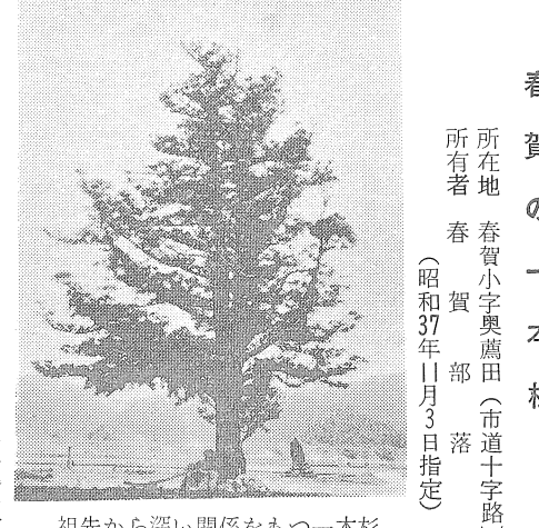
祖先から深い関係をもつ一本杉

所在地 春賀小字奥田(市道十字路) 所有者 春賀部 落 (昭和37年11月3日指定)