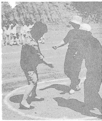
園児とともに元気がおあさんたち

児童福祉週間中の五月九日、日役夫人、沢井利孝さんご夫妻、武蔵、緑につつまれたランドでは、智識者さん市内有志が大洲学園遊戯に、綱引きに、かけっこに、お話を訪れ、園児を一日おとうさん、おおかあさんとして、子どもたちを励ます、河野市収入役をはじめ、岡福祉事務所長ら市関係者四名と丸本捐助