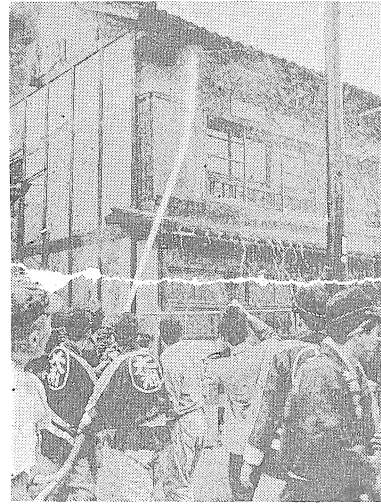
「小さな防火運動」のむら

「小さな防火運動」のむら、どしどし、ちよとした注意、格別の勇気も努力も必要、意を払ってこらえて多く 「小さな防火運動」のむら、どしどし、ちよとした注意、格別の勇気も努力も必要、意を払ってこらえて多く