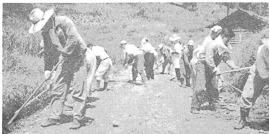
補修作業中の部落の方々

さき三月一日から一週間わたつて春の道路愛護週間が実施され、各地区で道路愛護員らが一日の奉仕作業を行ない、自動車の持主は私たちの道路は私たちの手で一日中バラなどを運び荒れた道路も見えがえるようになりました。