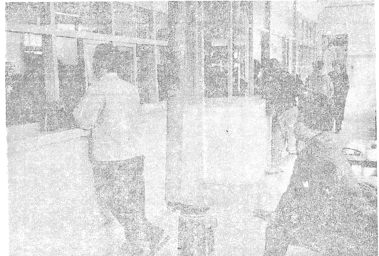
市民課受付のサービスぶり

登録もみなさんの正確な届出に基くものでなければ決して正しい人口とは云えないことになりす。そこで法律では住所が変つたり世帯主が変つたりした場合に必ず十四日以内に届出をする義務を負わせており、この期間内に届出を怠ると過料に処せられることになつています。最近住民登録制度も次第にみなさんの間に知られわたり、しかも住民票の利用も相当増加している関係上、昭和三十六年四月一日からは届出期間を超過された方々に対してはすべて簡易裁判所へ届出違反通知をすることになりました。みなさんの世帯におかれてもし変更が生じた場合は必ず十四日以内に届出を済ませ過料の制裁など受けることのないよう注意いたしまして、なお、届出は決してむづかしい手続ではありません。以前住んでいた市区町村発行の転出証明書と「はん」を持って市役所市民課、または連絡所へお出になれば簡単にできます。