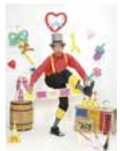
人気大道芸人 ムッシュみの吉