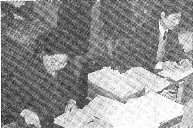
ただいま、みなさんからの掛金にかわる印紙を年金手帳にはっているとす

もうすぐ君たちは一年生、なかよし兄さん姉さんと、車に気をつけ学校へ。勉強時間は先生に、元気の返事でこたえます。思つたことはつきりと、みんなの前でいましょう。お昼はみんなと行儀よく、よくかみながら食べましょう。休みの時間は元気よく、運動場で友だちの誰とでもなかよく遊びましょう。勉強すれば先生や、みんなに別れのご挨拶。右側通行をすれず、道草せずにかえりましょう。もうすぐ君たちは一年生。