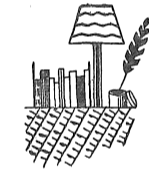
不幸があれば社会はその家の豊かさを差引き「ゼロ」