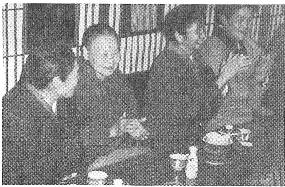
「アッハハハハハ」会員たちの笑い声はつきない(左から2番目が87才の児玉のおばあちゃん)

話の内容もみなそれぞれだが、とにかくこの会待つては、この会ができたのは昭和三十八年といふから、もう八年にもなる。会をつくったときから、今も役員をしていられる人たちが、いかに「なんかに集まることを始