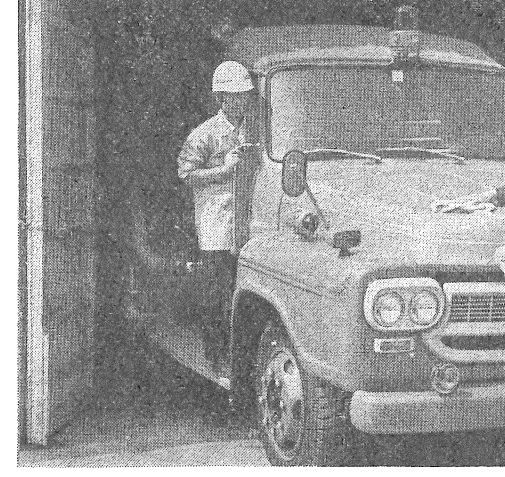
消防車の手入れも仕事の一つ