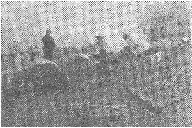
流れ着いたゴミを燃す「川を美しくする会」の人たち

どこの川も流れてくるのか、それを捨てるのか、ここはちよつと目を離すと、いつの間にかワラ、木切れ、ポリ容器など種々雑多なゴミ類が散乱してしまふところ。観光的に見苦しいばかりか、ハエなども発生して不衛生なため、近くの主婦ら