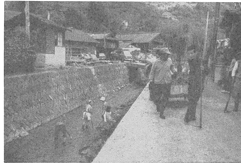
白滝川をそうじする「白滝地区保健衛生推進協議会」の人たち