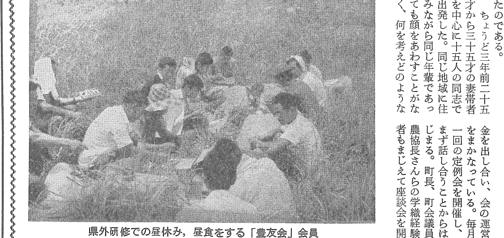
県外研修での昼休み、昼食をする「豊友会」会員