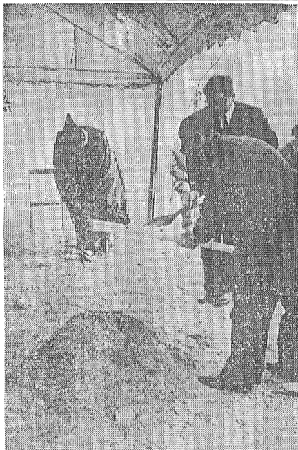
無事を祈つてくわ入れをする町長(手前側)