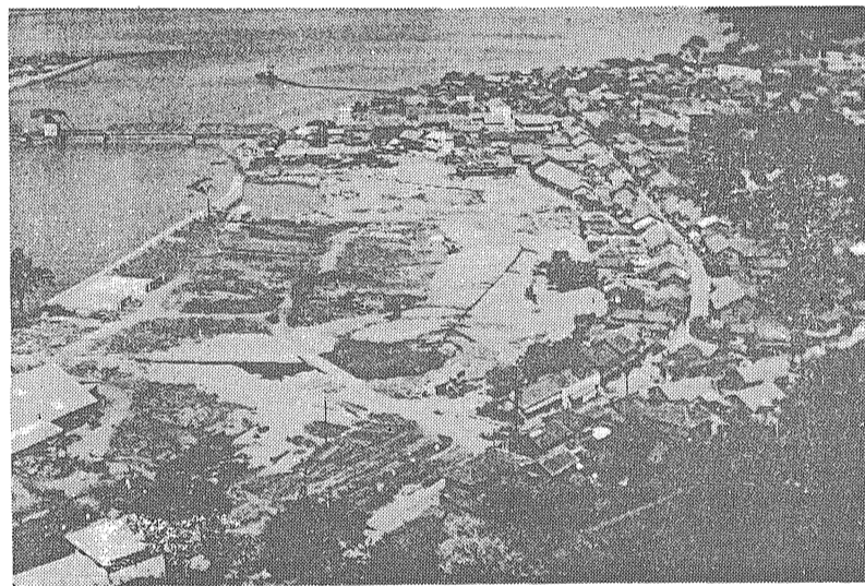
完成目前の中学校敷地 (9.1写) 埋立工事境界線工事急ピツチで進められている。 排水工事境界線工事急ピツチで進められている。

災害に伴う問題 昔から、おそろしいものゝ代表 として地震・雷・火事・おやじの 四つがあげられています。 四つのうち、地震と、雷は、自 然の現象です。火事と、おやじは 人間の起こすものです。ですから あとの二つは、避けようとするば 避けられるわけですね。 地震と雷は、全く自然の現象な ので、いまのところ、防ぐわけに はいきません。 地震になると、現在の学問では 地震がいつくるかを、あらかじめ 正確に知ることはできません。 さて、急にグラグラと大地がゆ れだしたとします。 人間には、身を守る本能があり ますから、何かを考える前に、自 分の体だけを守る行動をとるは ずです。 このとき、戸外で安全な場所 にいたときなら、「あたりの様子 を見たり、「静まるのを待つ」た りするでしょう。 つき、わが身の安全がハッキリ このへんまでは、自分の命を大 事にすること、肉身に對する愛情 で、私たちの気持は一杯です。 と、そろそろ物質的な欲が頭をも ち上げてきます。 家財や物がぬれないようにと荷 物を上げたり、逃げだすときには お金や貴重品を一つでも余計に持 たないで逃げます。