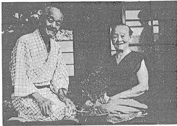
いつまでもお元気で.....