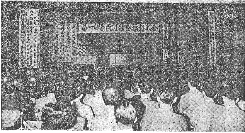
ぎつしりうずまつた大会会場

町と、町社協との共催で、九月二十九日、午前九時半から体育館で、才一回長浜町社会福祉大会が盛大に開かれました。