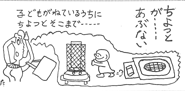
子どもがねているうちにちよつとそこまで