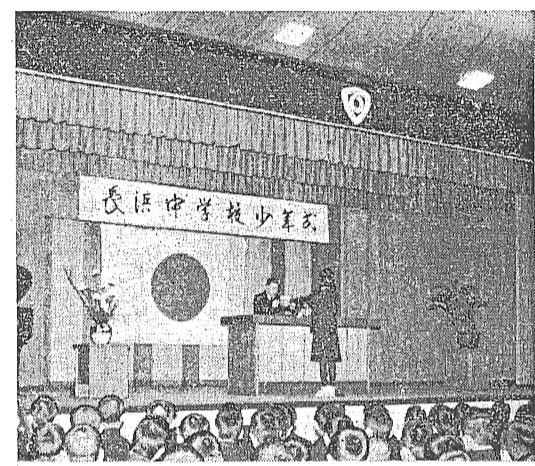
写真 = 自覚を新たにした少年少女

決定すべき重大な時期で、自己の特性を生かし、社会に貢献できるように、将来の方向を考え、決定する。