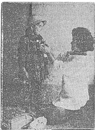
「新しい門出には温い愛のはげましのことばをもつて……」

【問】愛護班活動とは一口にいつて、どんな活動をするのですか? (長浜町 大字青島 T・H生) 【答】学校に、子供たちを行かせている親たちならだれでも、その一員である県PTA連合会が原教育委員とついでに昭和三十三年あたりから大きくとりあげている運動です。