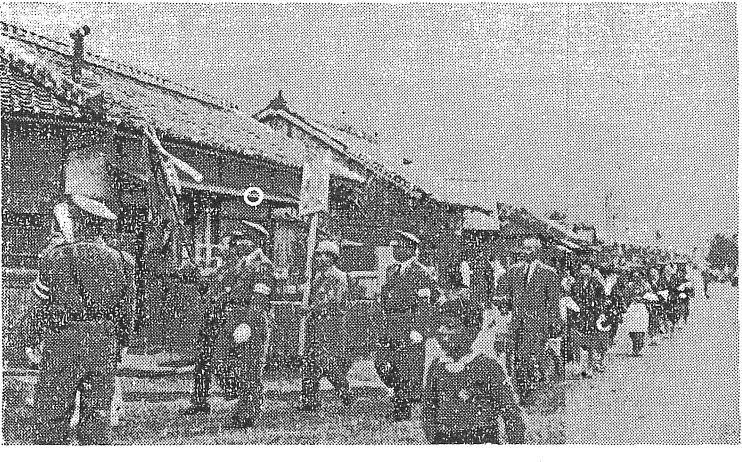
（写真は町長（○印）も参加した交通安全パレード）

長浜町交通安全協議会と大洲警察署では、去る十月二十六日、長浜町で、盛大な交通安全パレードを行いました。