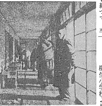
元気でお掃除をしておられる 養老院のおぢいさんおばあさん

去る旧正月の前日、衛生小学校生徒さんより 「お祝いのおくりもの、お返しを流して下さるようお願いいたします。」と、おくりものを下さり、お返しを流して下さるようお願いいたします。