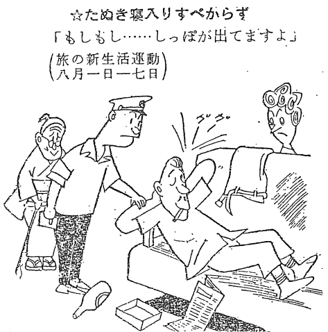
夏の防犯運動 長浜町警部派出所