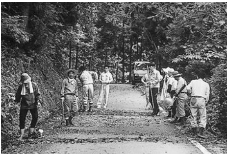
通行が気持ちよくなりました

今年も道路愛護一日奉仕作業に多数参加を頂き、暑い中草刈り清掃にご協力を頂き大変感謝しております。道路は村民の生活の一部として大きな役割を担っております。今後とも道路行政に格段のご協力を賜り、地域の発展につなごうと思っております。お疲れさまでした。