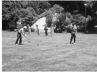
楽しい一日でした

からの大会は、熱戦が繰り広げられました。その白熱した試合を制したのは次のチームです。おめでとうございます。Aブロック 植松老人クラブA Bブロック 植松老人クラブB