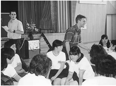
カッコイイ先生にポツ♥

生徒会が河辺の紹介をしたり、講師の方が自国の紹介をクイズを交えて行ったりして、最後に、交流活動・体験活動をふまえて、日本独自の文化であらう、