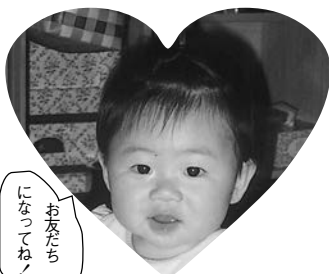
お友だち になっ てね!