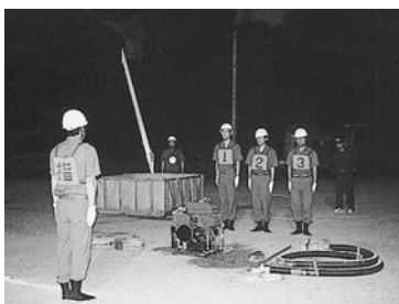
見よ!このりりしい姿を!