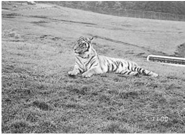
こっちに 来ないで！

子どもたちに、すてきな修学旅行をプレゼントしてください。保護者の皆様、行き帰りのバスを出してください。運転手さん、そして、さまざま