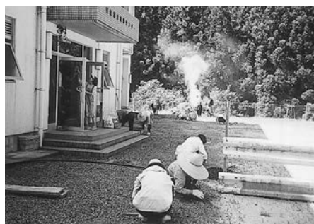
施設もピッカピカ

婦人会・中学生・分館合同によりまず施設清掃が、今年も四地区に分かれ実施されました。当日は、天候にも恵まれ、皆さん元気に清掃活動に汗を流されました。これにより、各施設もすっきりきれいになり、これからもコミュニケーション活動の拠点として、益々その機能が発揮されることと