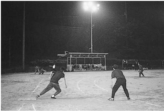
熱戦がくり広げられました

今年はナイターソフトボール大会から分館対抗試合が始まりました。消防操法練習の合間をぬっての試合日程となりましたが、天候にも恵まれ、予定どおり？全試合を終了することができました。今回も、女性の方々の参加も得、男性陣顔負けの好プレー、ヒットの連続に敵陣宮問わず、た