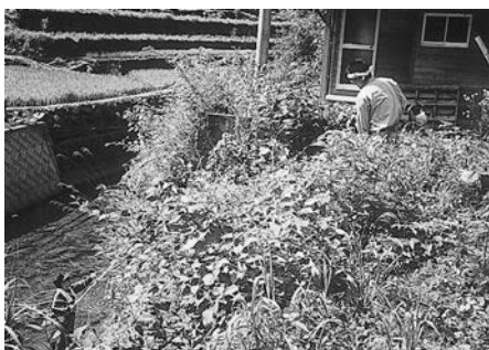
きれいになりました

当日は日差しも強く、大変むし暑い中での作業でした。これから、青年会議は地域に根差した活動を行っていき