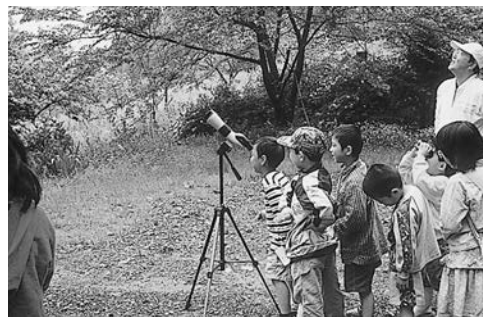
どんな鳥が見えるかな？

中居の神社を中心に、イカル、ホオジロ、カケス、ヤマガラ等をウォッチングすることができ、また、ツツドリ、シジュウガラの声も聴くことができました。春は、ヒナが卵