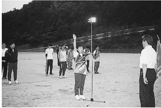
すばらしい選手宣誓でした

くさんの拍手喝采を浴びていました。そして、多くの好プレー、珍プレーの続いた大会を制したのは北平分館で、これで三連覇となりました。おめでとうございます。又、各分館役員、選手の皆さんお疲れ様でした。