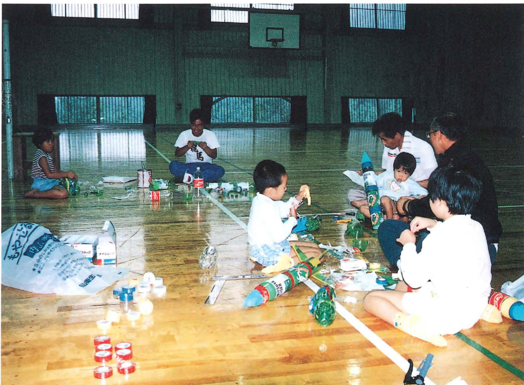
家族で協力し合ってロケットづくり