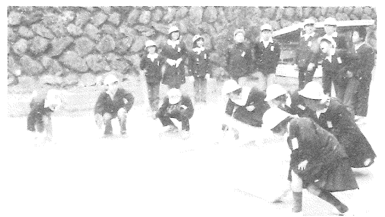
声張り上げて亥の子つきする児童たち

河辺小学校児童会が「乙亥の日」に校長先生の発案で、昔なつかしい「亥の子」つきをおこないました。