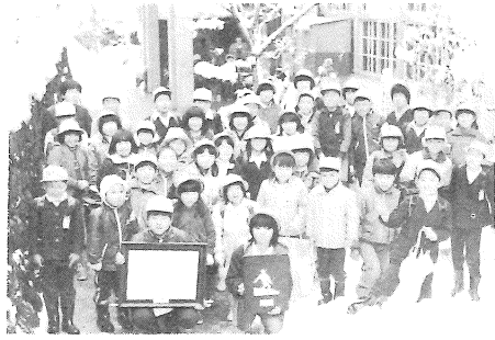
国全表彰を受け喜ぶ児童たち

で、物やお金の有難さを知らず無駄づかいの生活に慣れてしまっている。本校でもそうした傾向は見られるが、ことお金に関しては、親の躰もさることながら伝統教育の賜物であろうか毎月の貯金日には、ほとんどの児童が何がい