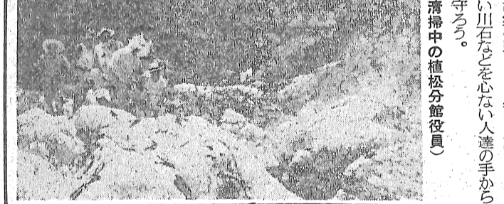
(河川清掃中の植松分館役員)

山と水と澄み切った空気に恵まれた私達の故郷、この数年來、道路の改良、新設にともない、自動車がいち早く増加し、気さくさされるような気がする。現在、いったい村にどの位の自動車があるか調べて見ると、驚くべき数字が現れている。驚くべき数字が現れている。驚くべき数字が現れている。