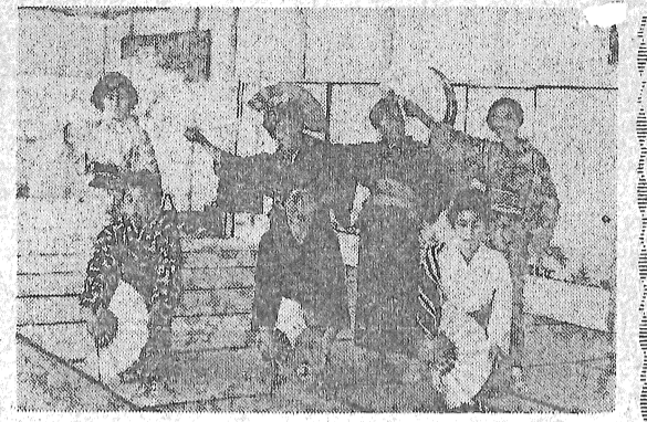
民踊輪の会 5月例会風景