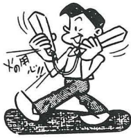
秋の全国火災予防運動 （11月9～15日）