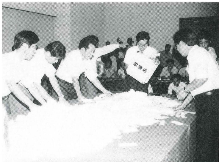
▲市役所大ホールでの開票風景

今回の選挙では、定数二十二二人に対し、新人五人を含む二十三人が立候補して、九月十八日から二十四日までの期間中、激戦が展開されました。