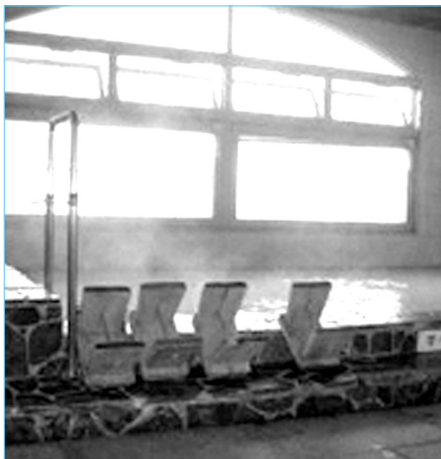
淡水風呂と潮風呂が併設されている「なぎさの湯」(長浜保健センター3階)

国土交通省では、平成29年10月末現在で、国が管理している樋門等37施設に対して、排水ポンプ車6台で、内水の状況にあわせて機動的に運用していると聞いています。このため、排水ポンプ車の運用については、まずは国管理区間への対応を検討の上、本市からの要請に基づき、支川等への支援が可能な場合は配備できると聞いています。