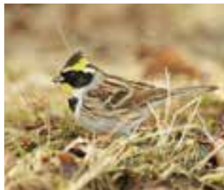
ミヤマホオジロ (深山頬白) スズメ目 ホオジロ科 全長 15.5cm

中国北東部や朝鮮半島で繁殖して、冬鳥としてやって来るホオジロの仲間です。明るい林や下草のある所を好み、ススキや雑草の種子をついばみます。特徴は黄色と黒の模様、ベッカムヘア(頭の羽毛を逆立て)で、白いお腹に三角のエプロンをかけた、おしゃれな姿をしています。