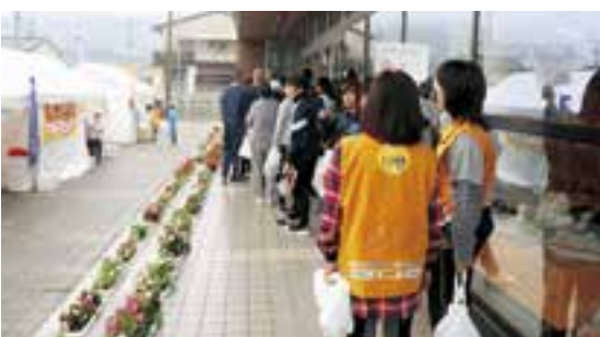
日替わりでふるまわれた大洲コロッケといもたきも好評でした