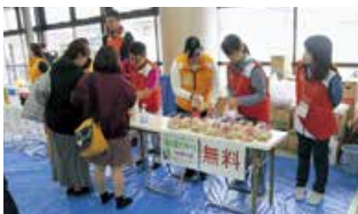
ドリンクコーナーのボランティアや係員のみなさん桑の葉クッキーもふるまわれました