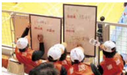
情報支援ボランティアのみなさんが、要約筆記と手話で情報伝達をサポートしました