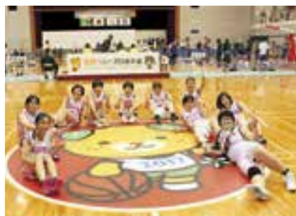
コート中央の大きなみきゃんと記念撮影準優勝の秋田県女子チーム