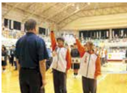
愛媛県チーム代表の選手宣誓で大会スタート