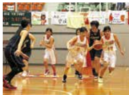
スタンドには応援幕がずらり対大阪市（女子）