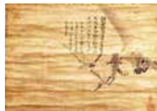
中江藤樹筆黄鳥画賛 1幅 大洲市指定有形文化財(書跡) 個人所有

当資料は、一羽のウグイスが梅の古木の枝に止まっている墨画に中江藤樹が賛文を記したものです。墨画の作者は、伊予松山藩主松平定行に仕えた御用絵師松本山雪(1581?~1676)で、一時藤堂高虎にも仕えたとされる人物です。