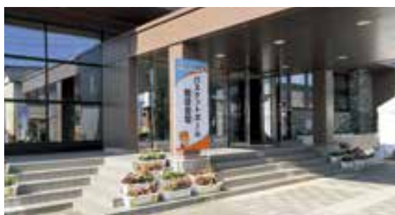
市内の高校生が育てた花が体育館周辺を彩りました