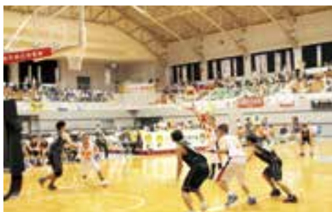
愛媛県選手のフリースロー対大阪市（男子）