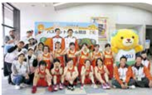
愛媛県女子チームとサポートボランティアの大学生のみなさん