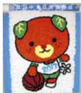
肱川中央自治会のみなさんがカヌーに引き続き花紙で制作