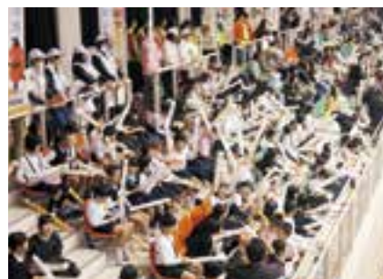
喜多小学校の300人あまりの児童が試合ごとに声援を送りました