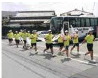
リレー隊は公募で選ばれた市内小中学生で構成

点火式会場では、ステージ上に到着した最終走者のトーチから、清水市長のトーチへと炬火が引き継がれ、二人の手で炬火受け皿へ点火しました。