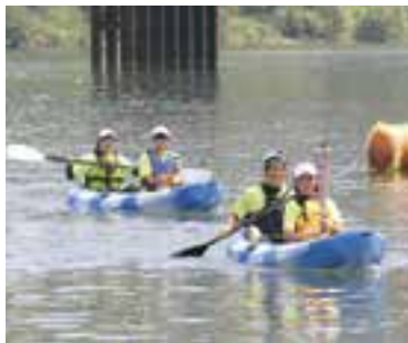
国体カヌー選手が漕ぎ手を務めました。

採火棒から炬火トーチに点火され、大洲市の火が誕生。肱川を下るカヌー隊により、炬火リレーがスタートしました。