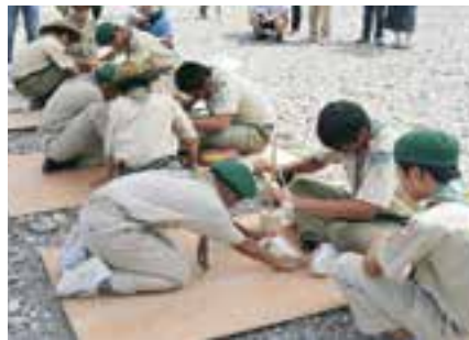
日本ボーイスカウト愛媛県連盟 大洲第一団のみなさん

採火棒から炬火トーチに点火され、大洲市の火が誕生。肱川を下るカヌー隊により、炬火リレーがスタートしました。