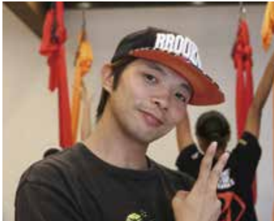
ダンスチーム「ぽっぷこ～ん☆」