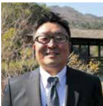
「みなさんに早くとけこみ、少しでも地域発展の役に立ちたい」

河辺地域と戒川地区を中心に活動を行う地域おこし協力隊が、4月から新たに2人着任しました。着任にあたり、4月3日(月)に市長より委嘱状が交付されました。