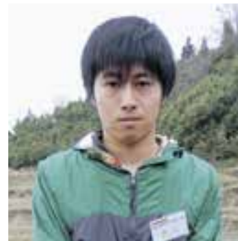
「定住に向けて、まずは地域になじむことを心がけたい」