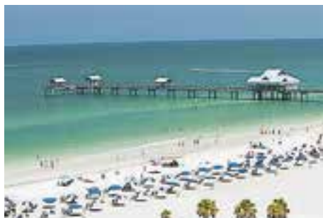
クリアウォータービーチ

私はニューヨーク州で生まれた後、フロリダ州に移り25年間過ごしました。タンパのサウスフロリダ大学を卒業後は、婚約者とテネシー州へ引っ越しました。3年間小学校の教師として働いた後、昨年12月に愛媛にやってきました。今回で2度目の来日になります。