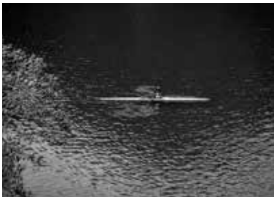
平成28年度推薦受賞作品「アメンボウの如く」

【テーマ】 肱川町の四季 【応募上の注意】 平成28年7月から平成29年6月未までに撮影した未発表の作品に限ります。応募は1人3点までです。 【サイズ】 四ツ切、ワイド四ツ切およびこれに準ずるもの 【締め切り】6月30日(金) ※当日消印有効 【応募・問い合わせ先】 〒797-1592 大洲市肱川町山鳥坂74番地 肱川支所 地域振興課 ☎2311