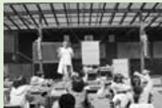
ポコベン青空小学校

2017年3月の時点で大洲、喜多、平、久米、平野、新谷小学校の6校の5年生の合計生徒数は約何人でしょうか。