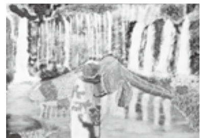
【初飛行の赤トンボ】