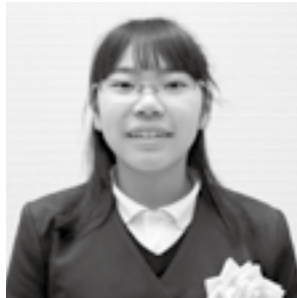
第27回読書感想画中央コンクール 小学校高学年の部