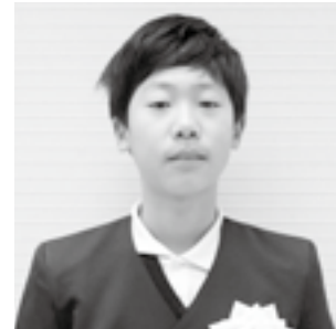
第31回「WE LOVE トンボ」絵画コンクール 小学6年生の部