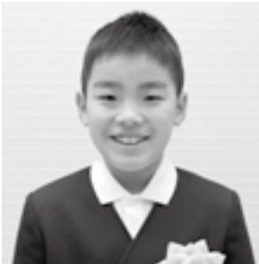
第8回こども環境大賞 絵画部門