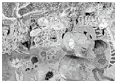
【ずっといっしょだよ】

「ぼくと象のものがたり」を読み、絵で表現しました。将来は、絵で人に感動を与える仕事をしたいです。