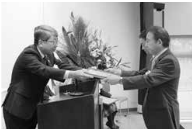
表彰を受ける少彦名神社参籠殿修復実行委員会

市の文化の向上発展に関し、特に顕著な業績または成績を取めた個人、団体に贈られるもので、今年度は3個人2団体が表彰されました。