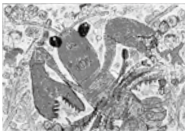
【おおきな ざりがにが とれたよ】