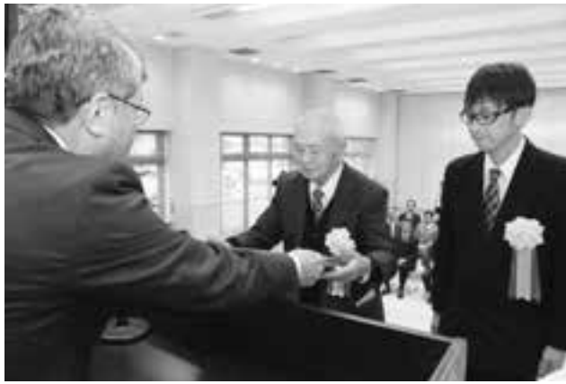
表彰を受ける粟津祇園太鼓保存会

での活動を認めていただき、感謝している。先輩をはじめ、地域のみなさんのご協力があったからこそ受賞。今後も地域の発展のためであれば、労を惜しまずやっつけたい」と、受賞の喜びと今後の抱負を語りました。