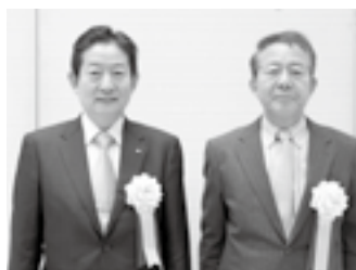
ユネスコアジア太平洋文化遺産保全賞