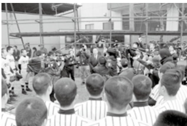
谷本校長から出場決定の報告