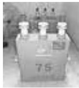
高圧トランス 高圧コンデンサ