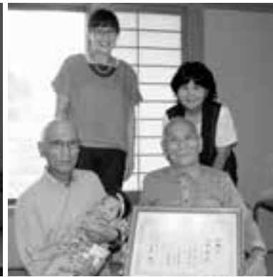
仲よし四世代家族