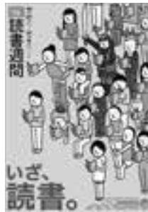
【2016読書週間ポスター】

ずっと読みたかった本を手に入れたときでも、手持ち無沙汰に何げなく本を手にとったときでも、一度本を開くと、その世界に引き込まれてしまいますよね。好むと好まざるとに関わらず、本は私たちに虜にします。