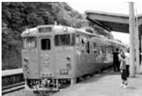
大勢に見送られ、また次の駅へ