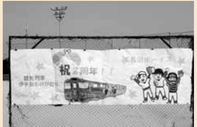
オリジナル横断幕も登場