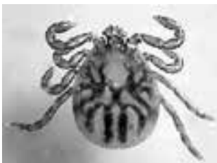
キチマダニ（吸血前）