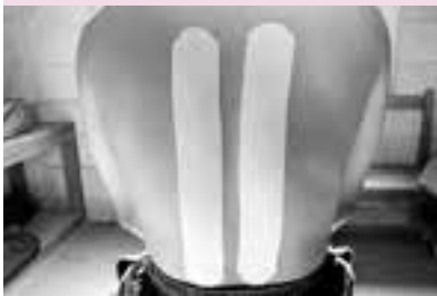
背筋に沿ってテープを貼る。