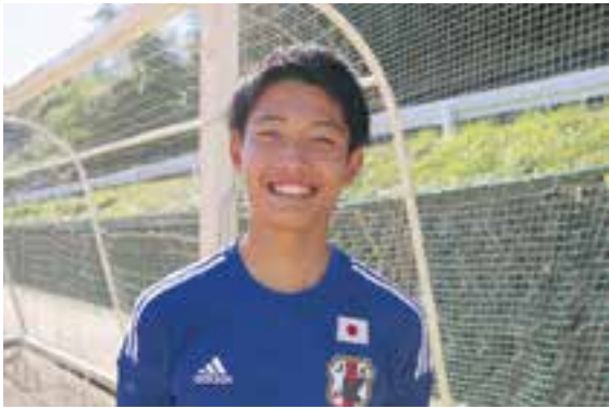
大洲北中学校3年 FCゼブラ所属 U-15 (15歳以下) 日本代表 (AFC U-16選手権2016※予選モンゴル遠征メンバー)