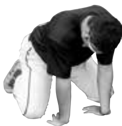
⑥手首の柔軟 (東風平投手)