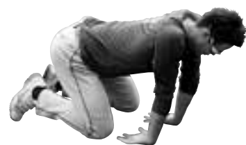
⑦手首の柔軟 (大道外野手)