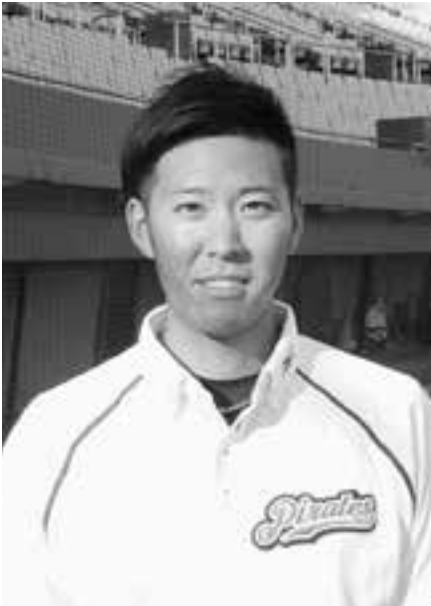
愛媛マンダリンパイレーツ トレーナー

テーピングで痛みを耐えながら運動をしても、いつものようなパフォーマンスができません。部活動や職場のサークル活動などで運動をしている人も無理をしないでください。休む勇気も必要です。