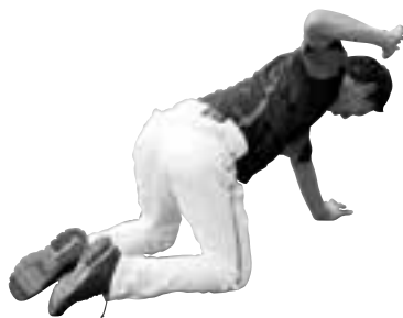
⑤肩関節の柔軟 (亨彰内野手)