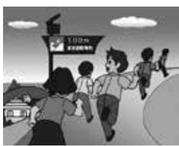
イラスト出展：消防庁ホームページ ( http://www.fdma.go.jp/index.html )

近くの高台へ避難しましょう。高台がない場合は、3階建て以上の建物へ避難しましょう。津波は、繰り返し襲ってくるので、津波警報などが解除されるまでは、継続して避難する必要があります。