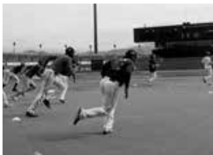
⑱各種ダッシュを繰り返し、体を温める (愛媛MP選手のみなさん)