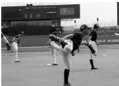
⑮大腿筋の柔軟 (愛媛MP選手のみなさん)