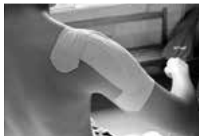
可動制限がないか確認する。