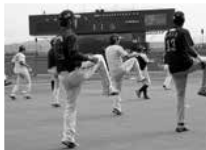
⑯股関節の柔軟 (愛媛MP選手のみなさん)