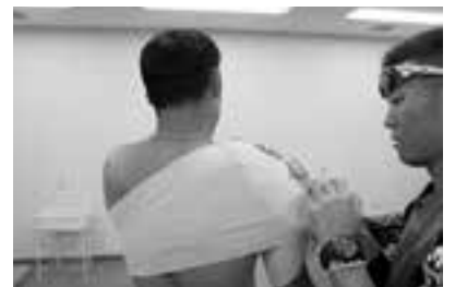
しっかり固定したら、冷却時間（10～15分）をタイマーで計測し、冷やしすぎないように注意する。