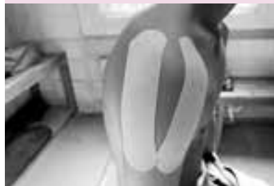
三角筋に沿ってテープを貼る。