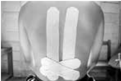
特に痛みを感じる部分をカバーするように貼る。 (写真は、腰痛がある場合)