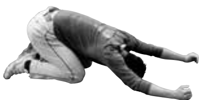
③肩関節の柔軟 (大道外野手)