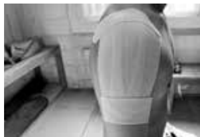
テープの両端を剥がれないようにテープで止める。