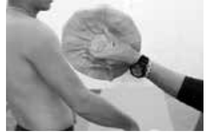
氷のうに氷を入れ、中の空気を抜いて板状にすることで、患部への接触面積を増やす。