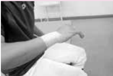
肌がかぶれないように、アンダーラップを巻く。