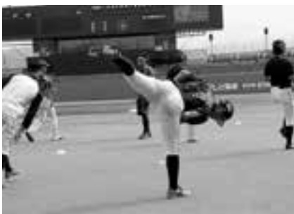
⑰大腿筋の柔軟 (愛媛MP選手のみなさん)