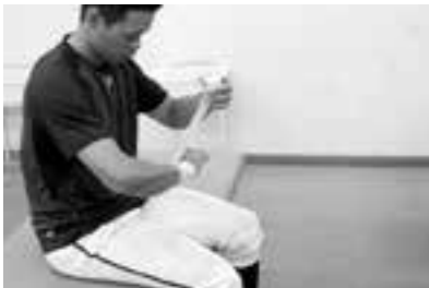
アンダーラップの上にテープを巻き固定する。