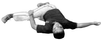
⑨腰の柔軟 (東風平投手)