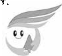
森林環境税イメージキャラクター「E～もりくん」