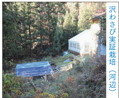
沢わさび実証栽培（河辺）

答 平成24年度からハウスで沢わさびの実証栽培を実施している。昨年11月には、初めての収穫となり、当初定植した6種類のうち4種類が成長したが、ハウスでの栽培は費用対効果の問題が大きいという結果になった。このことから、今後は経費の掛かるハウス栽培ではなく、露地で