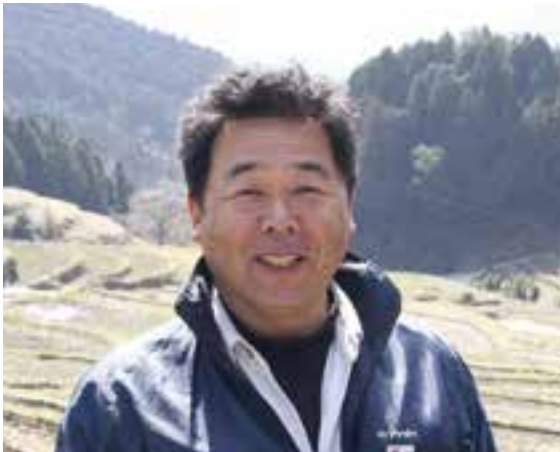
かしはに 榎谷棚田保存会