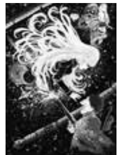
昨年の大賞作品(メモリアル)