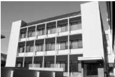
【完成した庁舎別館】