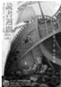
【2014読書週間ポスター】