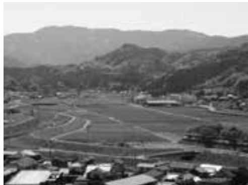
大洲城天守閣より久米地区を臨む