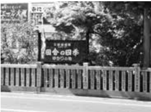
十夜ヶ橋にある看板

眠る蝶々 とび立つひばり 吹くや春風 たもとも軽く あちらこちらに 桑摘む少女 おとめ 日まし日ましに 春蚕 はるこ も太る