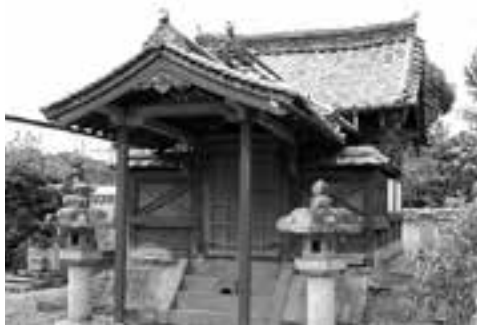
龍護山曹溪院にある光泰の靈廟

現在の光泰の靈廟は、文政5年（1822）に造営されたもので、龍護山曹溪院にあります。歴代藩主の墓碑の中で、唯一家の形をした厨子や朱色に塗られた覆屋が他の藩主の墓所にはない特徴です。これは、大洲藩が光泰を他の藩主と区別化し、特別な存在として位置付けようとしたものと考えられています。