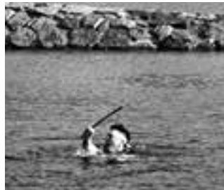
大洲神伝流泳法 愛媛県指定無形文化財 大洲神伝流保存会

毎年成人の日に披露されている「大洲神伝流泳法」は、全国に残る古式泳法の一つで、今年3月には全国で13番目となる古式泳法「主馬神伝流」の認定を受けました。