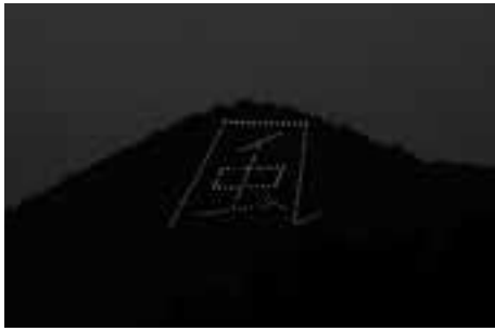
風のイルミネーション整備 (正山自治会)