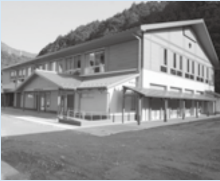
完成した大洲東中学校屋内運動場