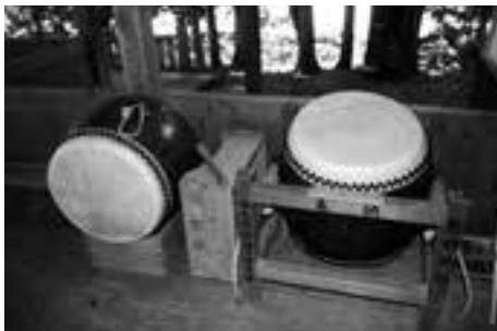
練子獅子備品整備 (田処熊野神社練子保存会)