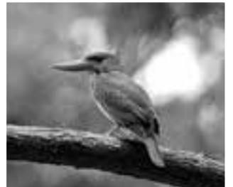
アカショウビン (赤翡翠) ブッポウソウ目 カワセミ科 大きさ27cm

春のゴールデンウィークのころに、南方から渡来する珍しい野鳥です。大きく真っ赤なくちばしが特徴で、全身は赤橙色と腰に薄い水色の模様があります。カワセミの仲間ですが魚を主食とせず、カエルやカタツムリ、サワガニなどを食べ、薄暗い林に住んでいます。そのため、姿を見る事は非常に難しく、バードウォッチャー(野鳥を見る事を趣味とする人)に人気があります。「キョロロローン」と、早朝や雨模様の時によく鳴くため、「雨乞い鳥」との呼び名があるようです。