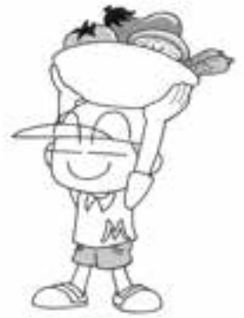
大洲市学校給食 オリジナルキャラクター モグモグくん