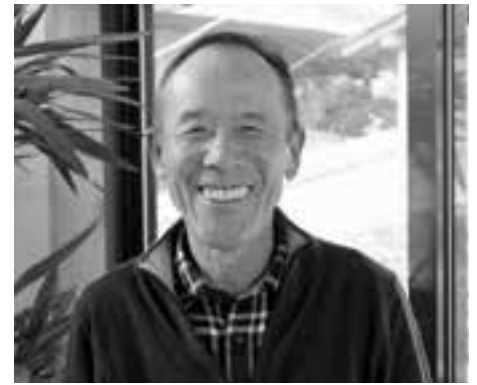
肱南地区 民生委員・児童委員

現在、高齢者の独り暮らしが増えているので、関係機関との連携を図りながら、安全安心な地域づくりを進めていきたいと思えます。