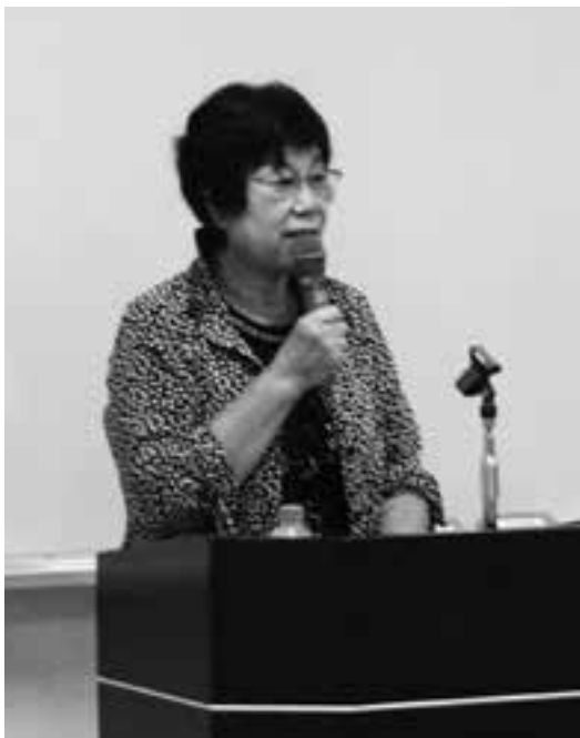
長浜観光ボランティアガイドの会

地域には素晴らしいものがある もっと多くの人に 地域に住んでいるみなさんに まずは知ってもらいたい